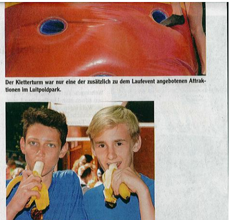
Gesunde Ernährung gehört zum Sport.