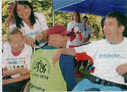
Gemeinsam laufen, das war das Motto des Tages. Und das nahmen auch die Menschen mit Behinderung mit Begeisterung auf.