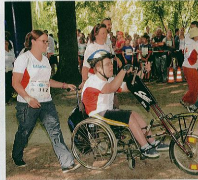
Gefährte der ganz speziellen Art gab es beim Spendenlauf zu sehen. Dieser Schüler lenkt und „tritt“ mit den Händen.