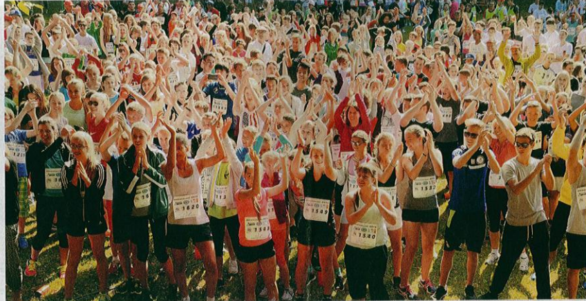
Kollektiv aufwärmen für den großen Spendenlauf des Leonhard-Wagner-Gymnasiums hieß es zu Beginn der Veranstaltung, die bei allen Beteiligten mit großer Begeisterung aufgenommen wurde.