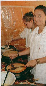
Crêpes war der große Renner des kulinarischen Angebots.