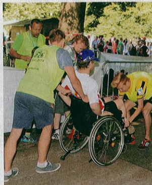
Bewundernswert, wie hilfsbereit die Schüler sich bei den Rollstuhlfahrern zeigten, hier beim Überfahren der Zielmatte.